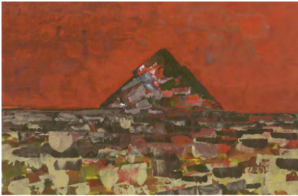
Mount Cooroy (Sunset) 2002 Scène d'une terrasse à Noosa Blue. Artiste Ian Bettinson.